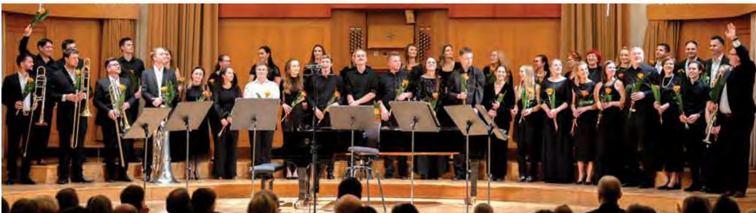
Koncert učiteljev v Slovenski filharmoniji, 28. 11. 2024

Skupno doživetje na nastopu naj vsem ostane v lepem spominu.