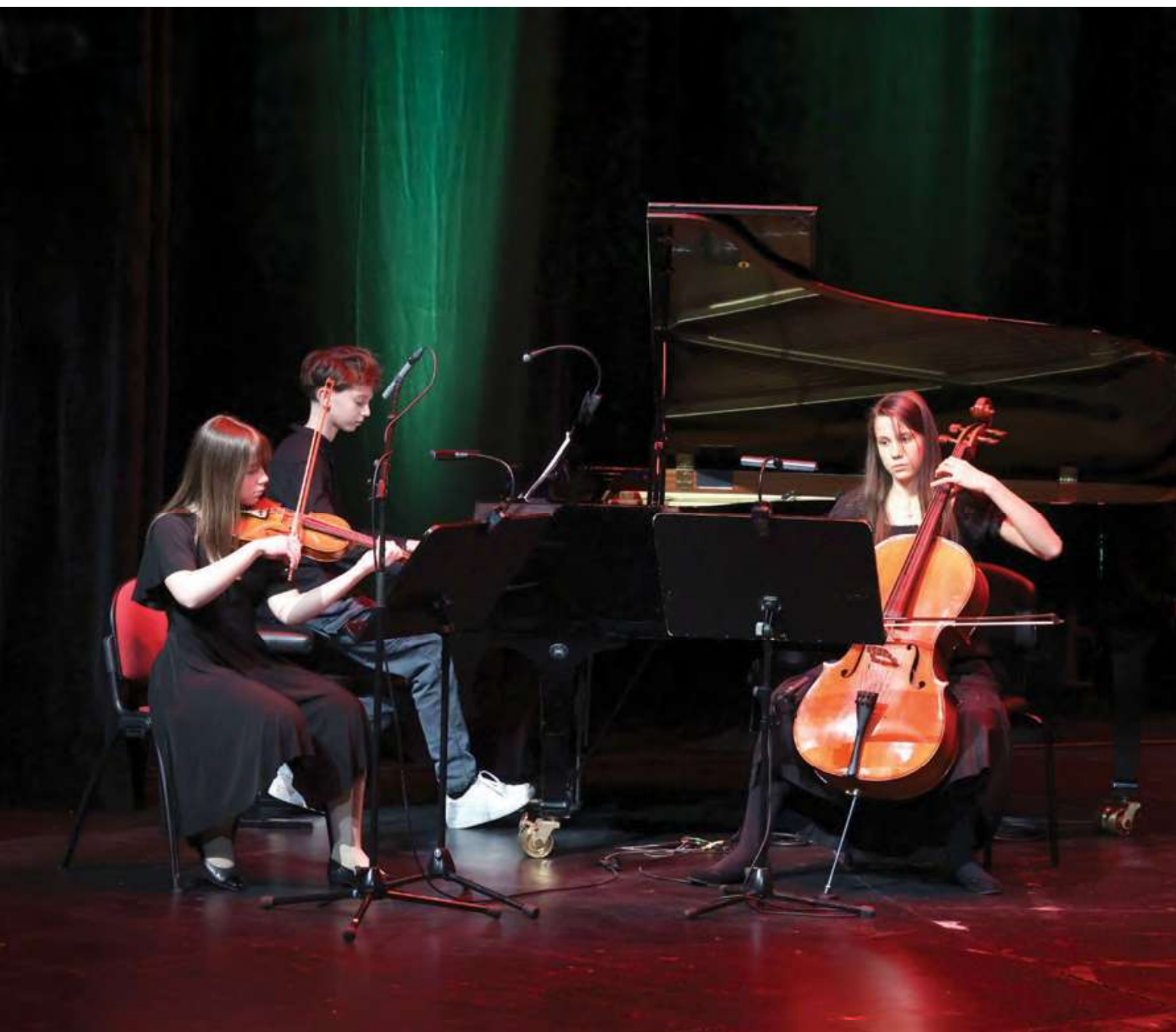
Godalni trio, prireditev MOL, ob 8. marcu v Cankarjevem domu, 7. 3. 2025