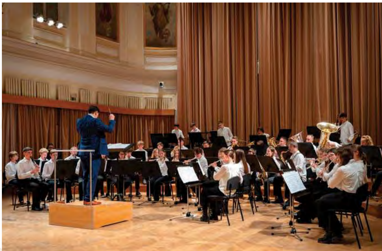
Pihalni orkester II, Koncert v Slovenski filharmoniji, 18. 2. 2025

Ob predložitvi glasbene beležke si učenci lahko v šolski knjižnici izposodijo notno, knjižno in avdio gradivo za dobo treh tednov. Izposojeno gradivo v knjižnico vrnejo pred podelitvijo spričeval.