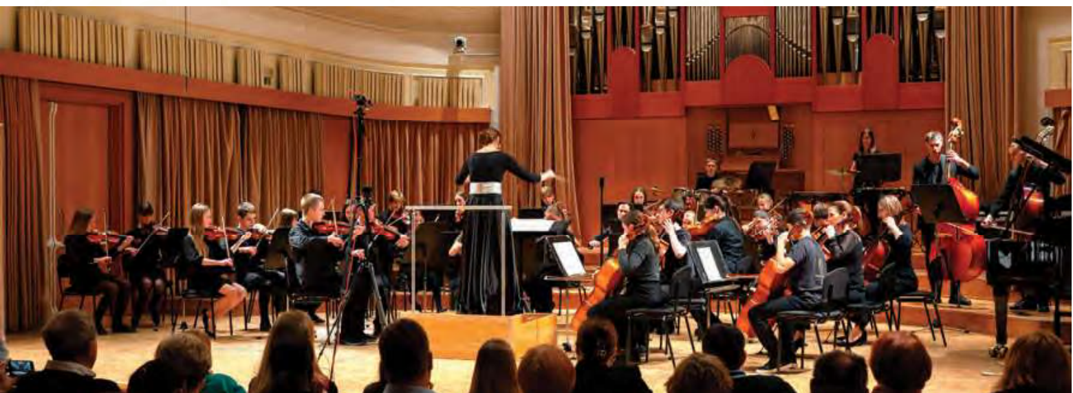
Godalni orkester II, Koncert v Slovenski filharmoniji, 18. 2. 2025

V okviru priprav za opravljanje sprejemnega preizkusa iz glasbene teorije in solfeggia bo za učence organiziran dodatni pouk solfeggia od začetka novembra do sprejemnega preizkusa v marcu 2026.