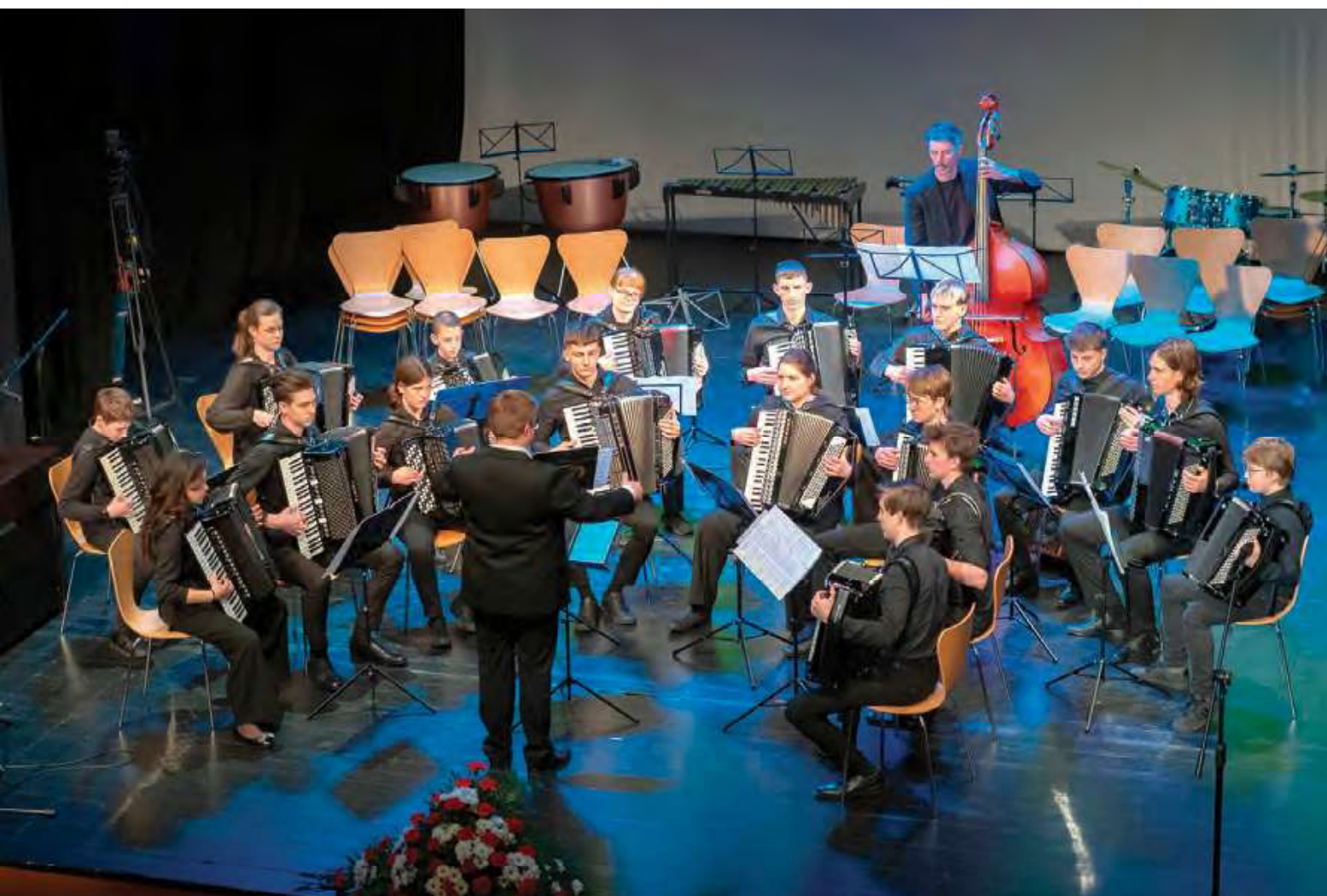
Harmonikarski orkester, Revija harmonikarskih orkestrov Slovenije, 4. 4. 2025

V skladu z Letnim razporedom delovnega časa za strokovne delavce lahko ravnatelj za zelo nadarjene in uspešne učence odobri dodatni pouk, ki ga učitelji opravijo v okviru drugega dela po 119. členu Zakona o organizaciji in financiranju vzgoje in izobraževanja - ZOFVI. O uvedbi tega dodatnega pouka se učitelj dogovori z ravnateljem, če pripravlja učenca za tekmovanje ali za sprejemni preizkus za vpis v srednjo glasbeno šolo ter zaradi priprave drugih aktivnosti in projektov, predvidenih v letnem delovnem načrtu. Maksimalno število ur dodatnega pouka za učenca je tudi v tem primeru 23 pedagoških ur letno, v izjemnih primerih in zaradi utemeljenih razlogov pa lahko ravnatelj odobri dodatni pouk v okviru drugega dela učitelja tudi več kot 23 pedagoških ur letno.