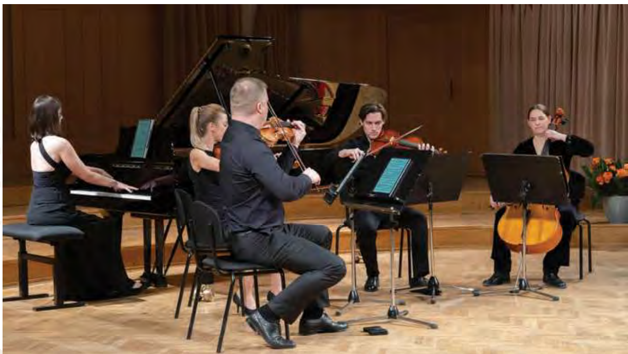
Koncert učiteljev v Slovenski filharmoniji, 28. 11. 2024