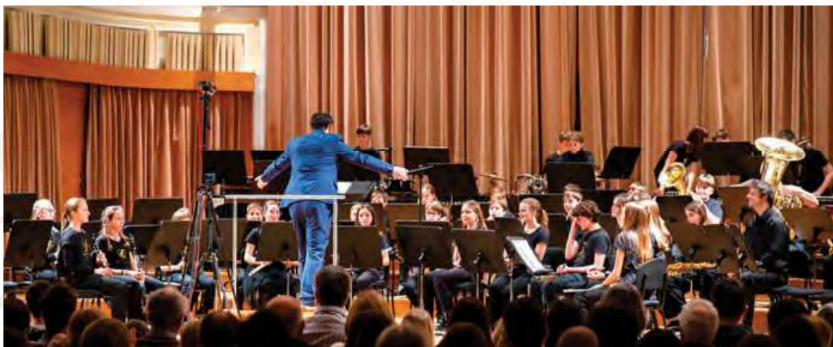
Pihalni orkester I, Koncert v Slovenski filharmoniji, 18. 2. 2025