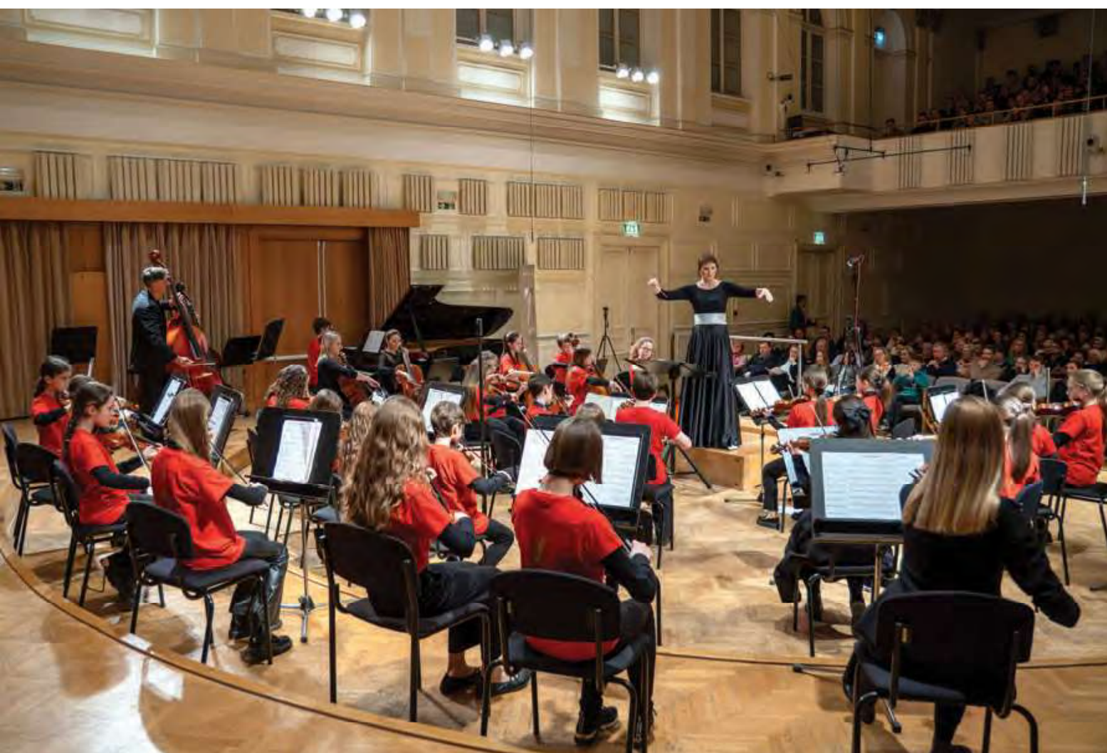
Godalni orkester I, Koncert v Slovenski filharmoniji, 18. 2. 2025