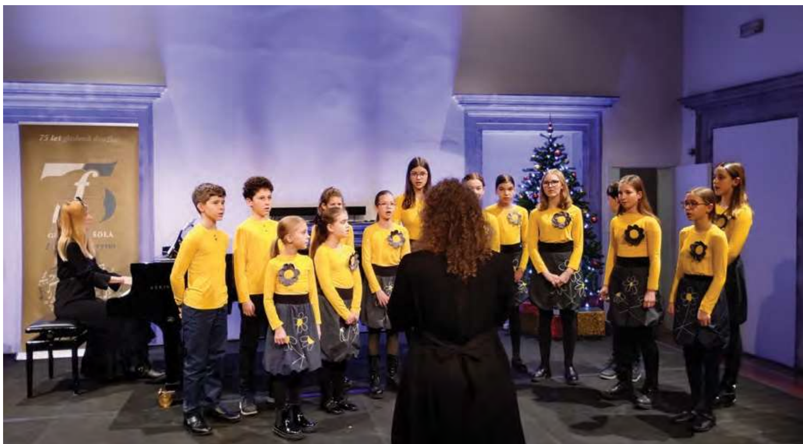
Mladinski pevski zbor, Božični koncert v Križankah, 19. 12. 2024