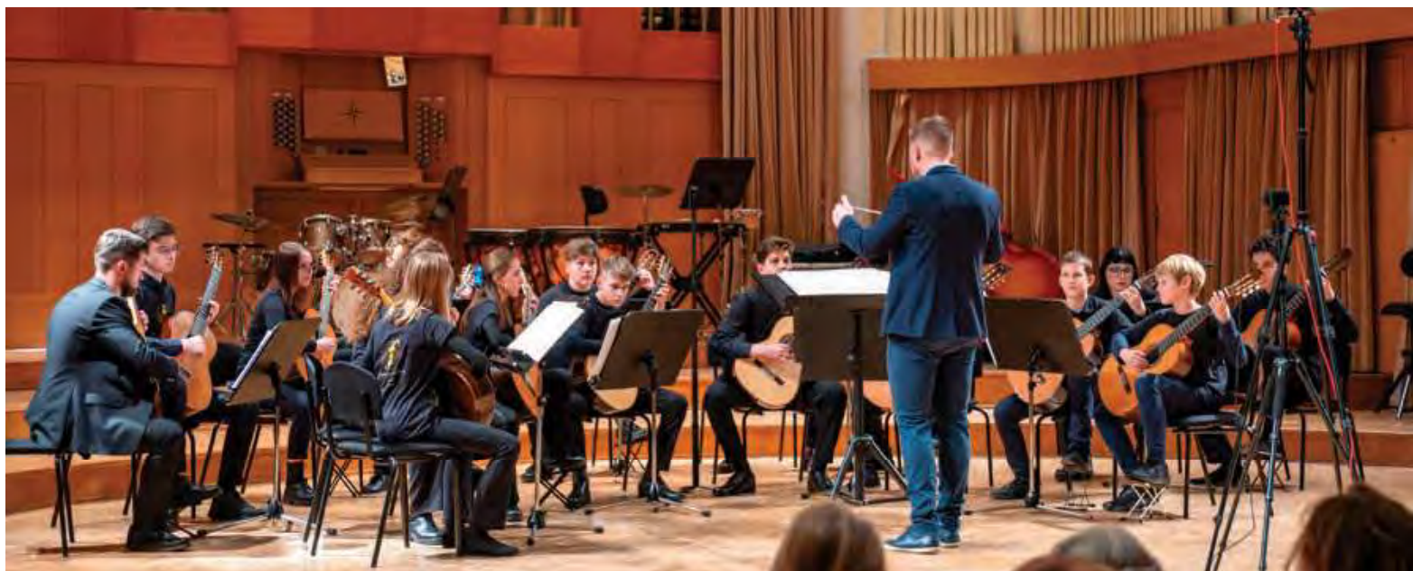
Kitarski orkester, Letni koncert v Slovenski filharmoniji, 4. 6. 2025

Izpitni roki so del šolskega koledarja 2025/26.