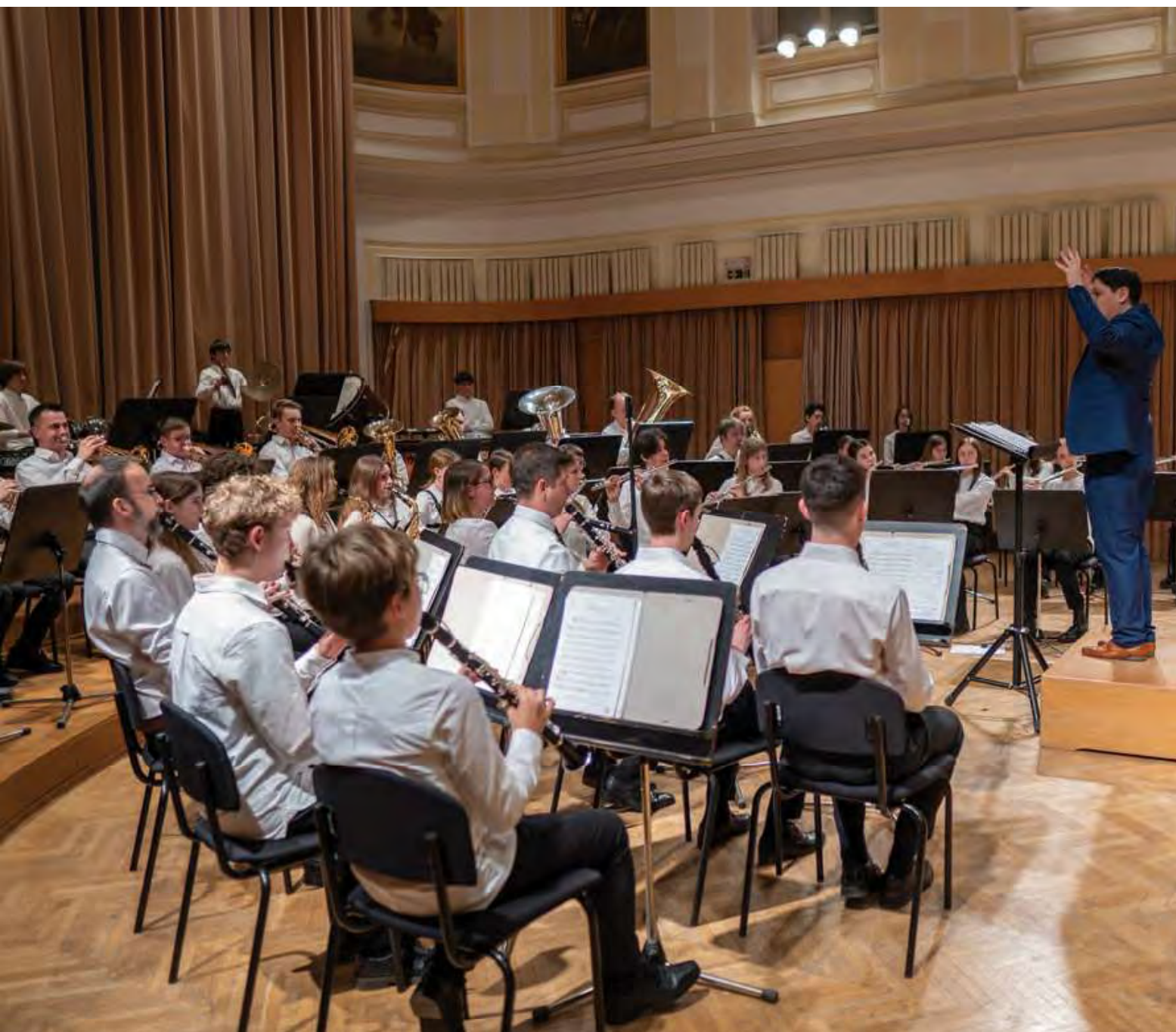
Pihalni orkester II, Koncert v Slovenski filharmoniji, 18. 2. 2025